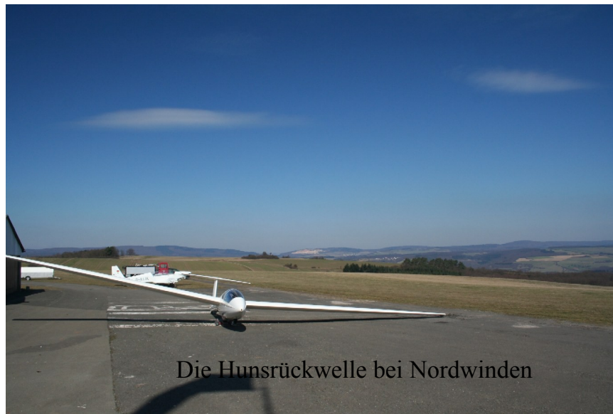
Die Hunsrückwelle bei Nordwinden