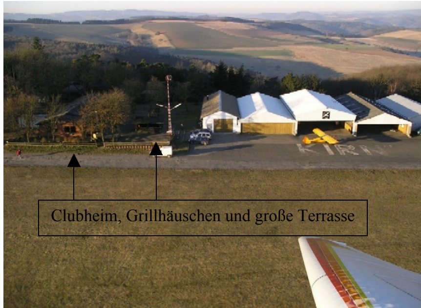
Clubheim, Grillhäuschen und große Terrasse